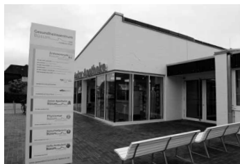
Die Praxis befindet sich im Gesundheitszentrum an der Westerstädte

Da der Tourismus ab nächsten Montag wieder anlaufen soll, plant auch die Notdienst-Anlaufpraxis im Ärztezentrum am 1. Juni wieder zu öffnen. Bei sehr großem Gästeandrang öffnet die Praxis möglicherweise auch schon früher. In der Anlaufpraxis werden abends und am Wochenende Fälle behandelt, die nicht bis zur nächsten regulären Sprechzeit warten können. Bei lebensbedrohlichen Notfällen ist weiterhin der Rettungsdienst unter 112 zuständig.