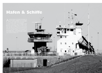
Ein kleiner Blick ins neue Heft