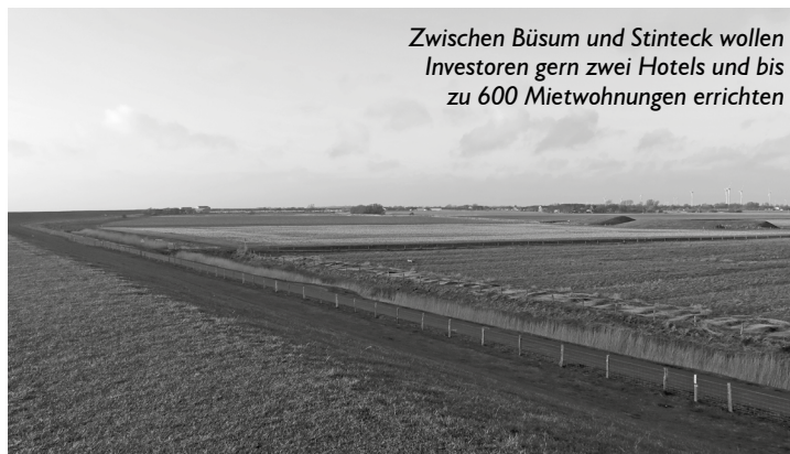
Zwischen Büsum und Stinteck wollen Investoren gern zwei Hotels und bis zu 600 Mietwohnungen errichten

Kommt ein neues Baugebiet zwischen Büsum und Stinteck? Bereits seit 2017 ist die Gemeinde mit Investoren im Gespräch, die auf der Fläche rund um das jetzige Deichmuseum einen ganz neuen Ortsteil planen, mit zwei Hotels, bis zu 600 Mietwohnungen sowie einem kleinen Einkaufszentrum und Kindergarten.