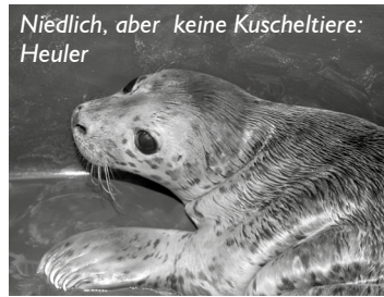
Niedlich, aber keine Kuschteltiere: Heuler

In Büsum sind Anfang der Woche die ersten Heuler dieses Jahres aufgefunden worden. So nennt man Seehundbabys, die von ihren Muttertieren allein gelassen oder getrennt wurden. Wer einen vermeintlichen Heuler sichtet, sollte sich ihm nicht weiter nähern und auf keinen Fall berühren – es ist durchaus möglich, dass sich das Muttertier nur kurz entfernt hat. Auf jeden Fall sollte über DLRG (Tel. 04834/909-