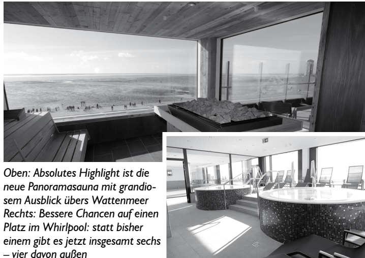
Oben: Absolutes Highlight ist die neue Panoramasauna mit grandiosem Ausblick übers Wattenmeer Rechts: Bessere Chancen auf einen Platz im Whirlpool: statt bisher einem gibt es jetzt insgesamt sechs – vier davon außen

Bei der Einweihungsfeier am letzten Samstag waren nicht nur die Redner voll des Lobes – auch die geladenen Gäste zeigten sich bei den Hausführungen beeindruckt, wie sehr sich das Gebäude verändert hat. Das liegt nicht zuletzt auch am neuen Farbkonzept der Fliesen, die die Farben der Umgebung des Bades aufnehmen. Viel zusätzlichen Platz schuf der dreigeschossige Anbau auf der Deichseite: Unten entstand ein Kursbecken mit Hubboden, eine Etage darüber ein großer Ruheraum mit Außenbereich für Schwimmbadbesucher, mit zahlreichen Liegen und Ausblick über Strand und Deich. Ganz oben befindet sich jetzt die erweiterte Sauna-Dachterrasse mit der großen Panoramasauna und einem Außenwhirlpool.