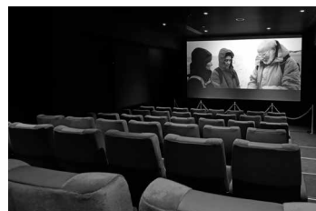
Das Kino „Lichtblick“ befindet sich im Obergeschoss des Watt'n Hus. Im Foyer gibt es die kinotypischen Snacks und Getränke. Spielplan und Online-Tickets unter www.kino-buesum.de

Dörte Hansens Roman „Mittagsstunde“ über den 47-jährigen Ingwer Feddersen, der in sein nordfriesisches Heimatdorf zurückkehrt, wurde ein Riesenerfolg. Inzwischen ist das Buch verfilmt worden. Die Rolle des Ingwer Feddersen spielt Charly Hübner; Regie führte der in